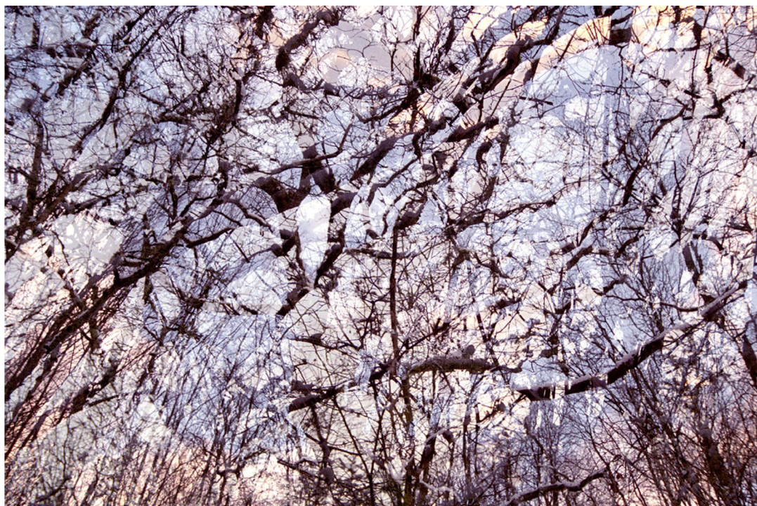
Osla Vena , tirage pigmentaire sur papier baryté contrecollé sur aluminium, 2004. © Étienne de France