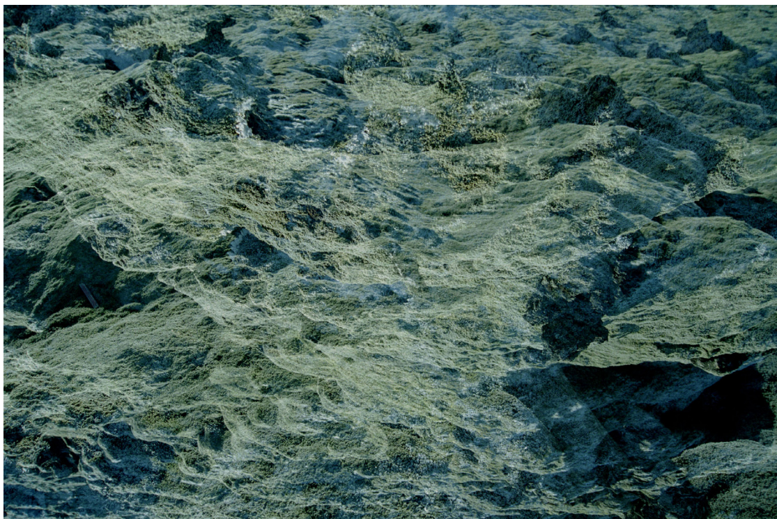
Orga IV , tirage pigmentaire sur papier baryté contrecollé sur aluminium, 2004. © Étienne de France