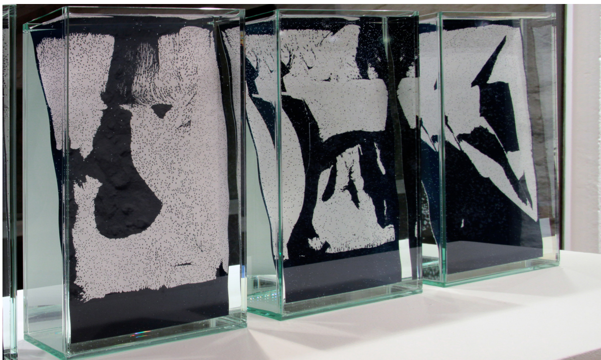
Série Spectre, vue partielle de l'installation à la galerie Sintitulo, sélection de 3 tirages photographiques sur papier immergés dans l'eau, présentés sous boîtes transparentes, 20 x 30 x 9 cm chaque, 2009-2010.