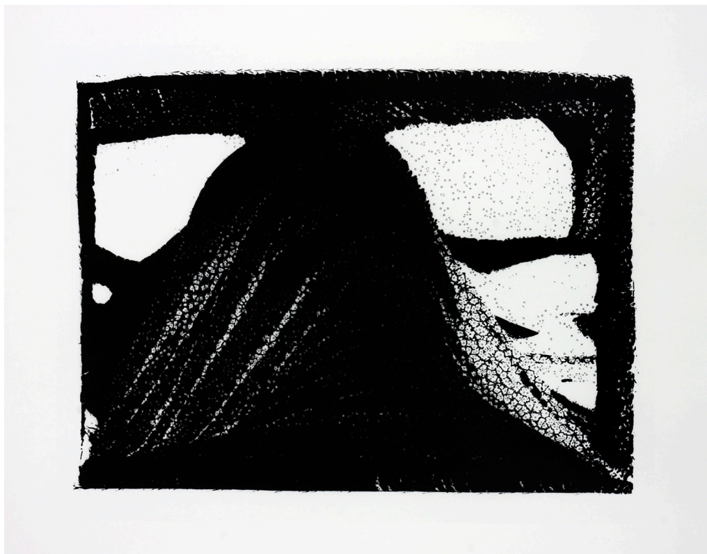
Sans titre, série Spectre (x30), projection d'un film instantané épluché, tirage argentique noir et blanc sur papier baryté, 47 x 57 cm, 2009-2010, IEX + IEA.