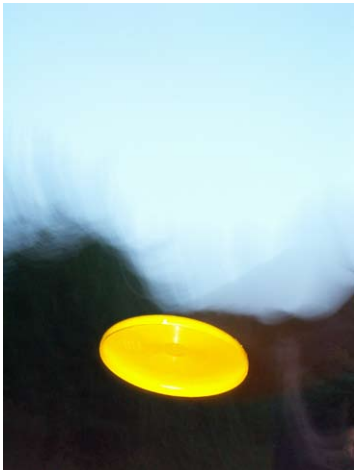
Série Errance , 2009-2010, tirage photographique sur papier « metallic » contrecollé sur plexi, encadrement caisse bois blanc, 20 x 26cm, 3 ex + 2 EA (dimensions non encadré)