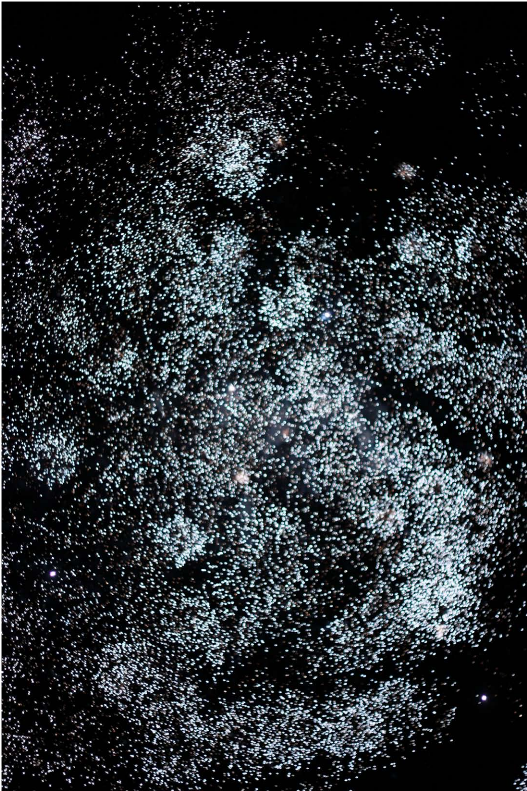
Série Errance , 2009-2010, tirage photographique contrecollé sur dibond, 100 x 150cm, 3 ex + 2 EA