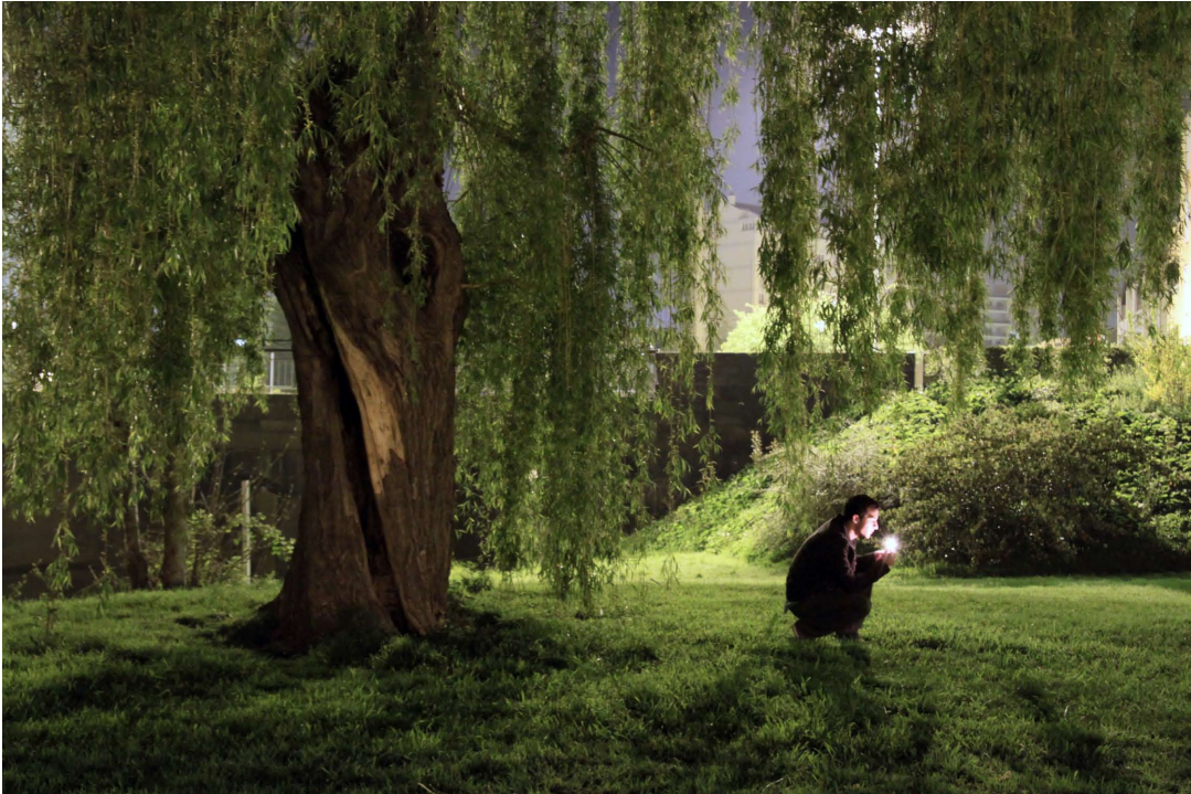
Série Errance , 2009-2010, tirage photographique sur papier « metallic » contrecollé sur plexi, encadrement caisse bois blanc, 80 x 120 cm, 3 ex + 2 EA (dimensions non encadré).