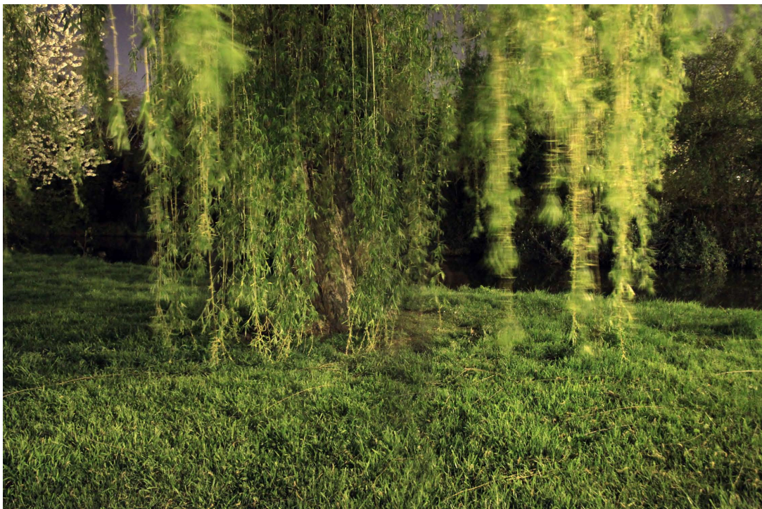
Série Errance , 2009-2010, tirage photographique sur papier « metallic » contrecollé sur plexi, encadrement caisse bois blanc, 80 x 120 cm, 3 ex + 2 EA (dimensions non encadré).