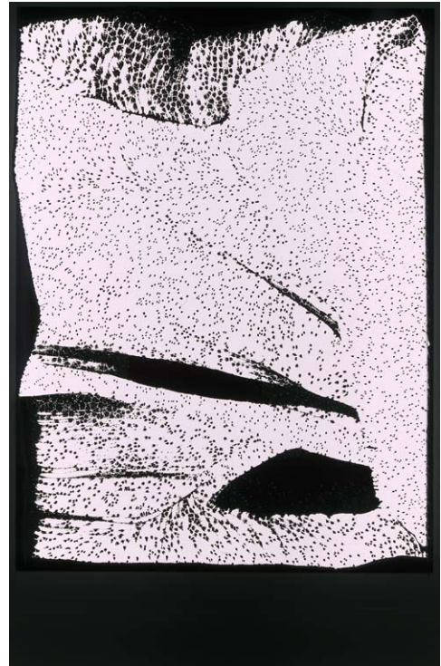
Série Spectre , 2009-2010, tirage photographique sur papier immergé dans l'eau, présenté sous boîtes transparentes, 20 x 30 x 9 cm.