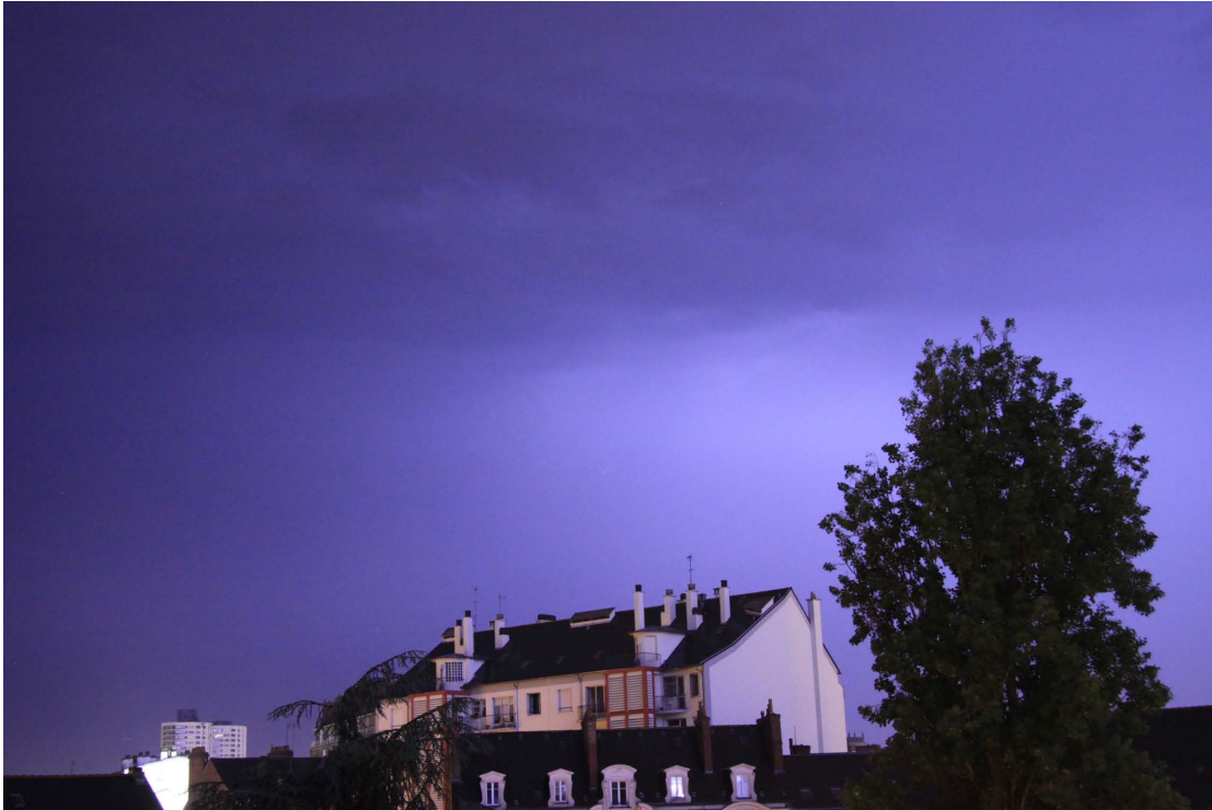
Série Errance , 2009-2010, tirage photographique sur papier « metallic » contrecollé sur plexi, encadrement caisse bois blanc, 40 x 60cm, 3 ex + 2 EA (dimensions non encadré)