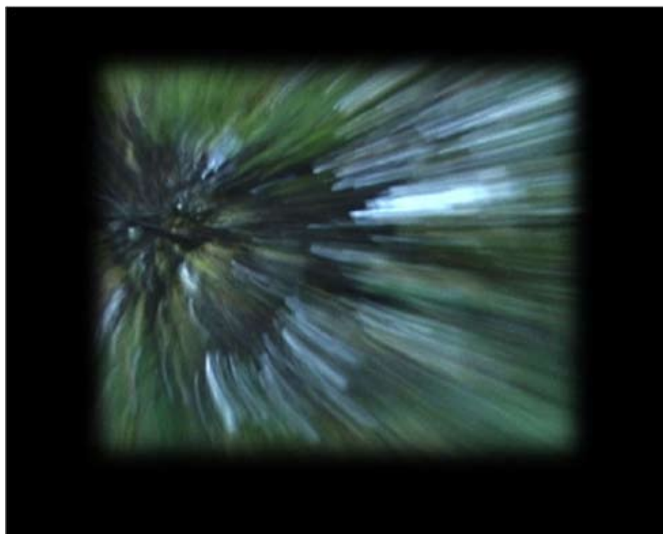
Still from Eyma , DV, 14 min 44 sec, 2006. © Étienne de France