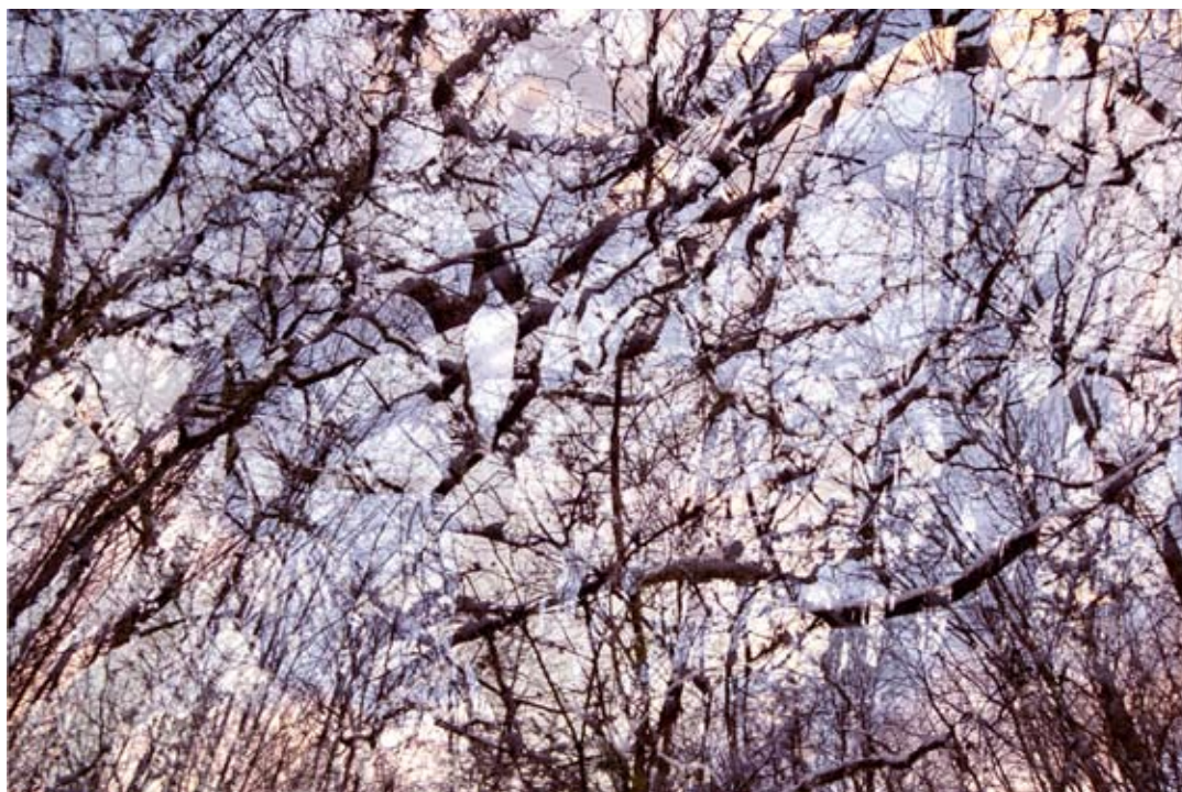
Osla Vena , tirage pigmentaire sur papier baryté contrecollé sur aluminium, 2004. © Étienne de France