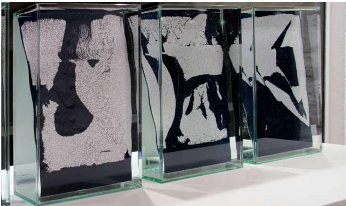
Série Spectre, vue partielle de l'installation à la galerie Sintitulo, sélection de 3 tirages photographiques sur papier immergés dans l'eau, présentés sous boîtes transparentes, 20 x 30 x 9 cm chaque, 2009-2010.