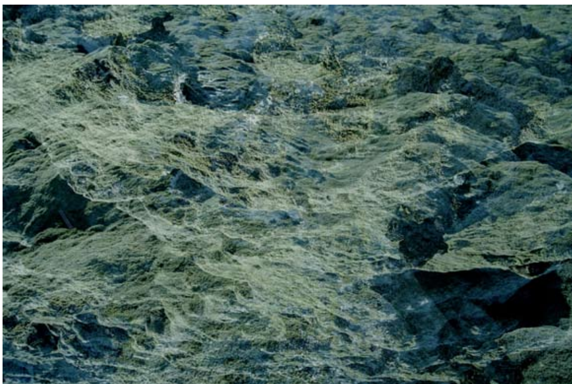
Orga IV , tirage pigmentaire sur papier baryté contrecollé sur aluminium, 2004. © Étienne de France