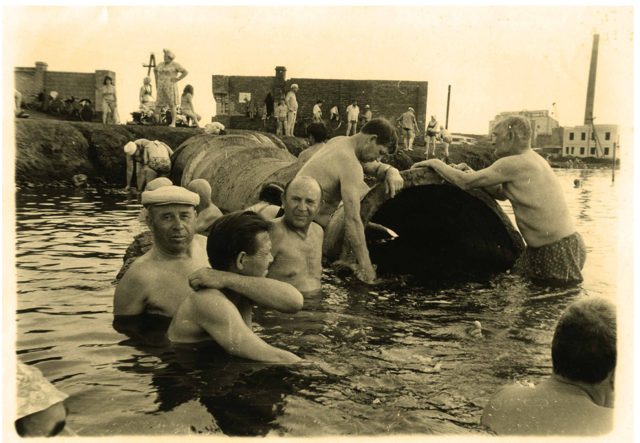
↗ Boris Mikhaïlov, Sans titre, de la série Salt Lake , 1986, Courtesy de l'artiste © Boris Mikhaïlov