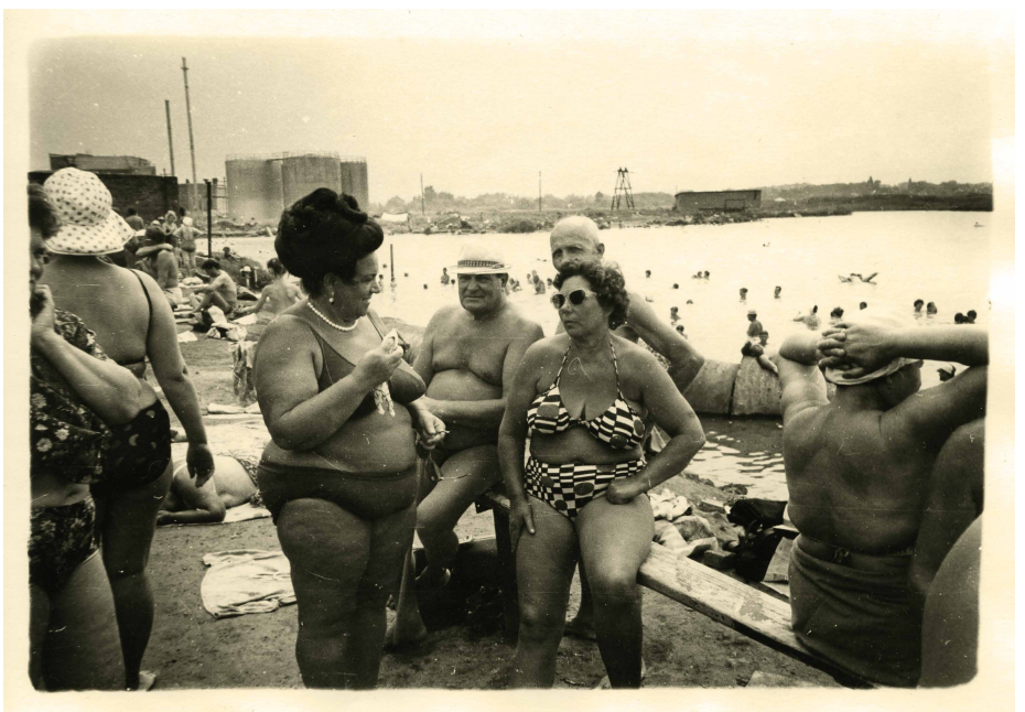
↗ Boris Mikhaïlov, Sans titre, de la série Salt Lake , 1986, Courtesy de l'artiste © Boris Mikhaïlov