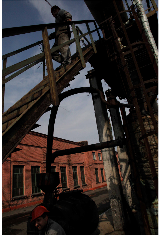
↗ Boris Mikhaïlov, Sans titre de la série Promzona , 2011, 190x125cm Courtesy de l'artiste et de la galerie Suzanne Tarasieve, Paris. © Boris Mikhaïlov